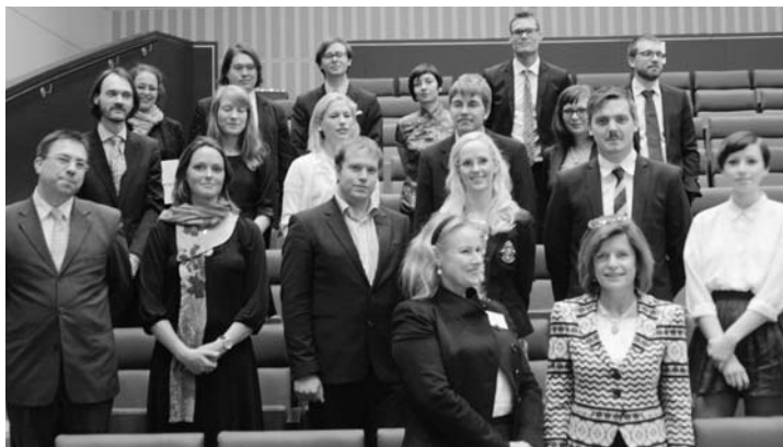
Vänster: Stipendiatutdelning 2011.