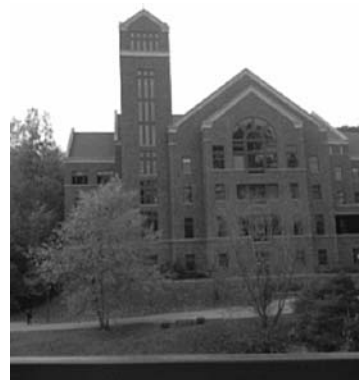
Biblioteket på Augustana College.