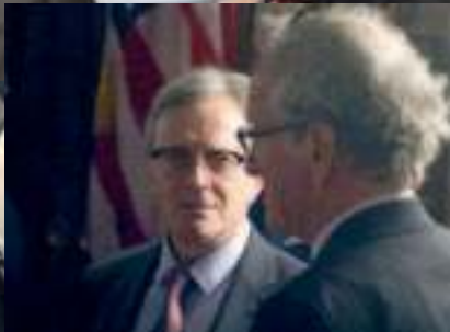
anslutning till bokens publikation hölls lm, som även blev Stiftelsens Homecoming 2018.