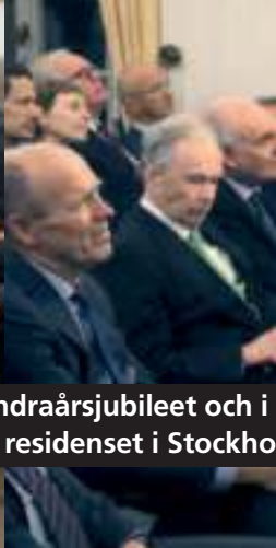
Som startskott för hundraårsjubileet och i en mottagning på Amerikanska residenset i Stockho